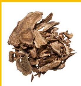
Jing Jie / schizonepeta