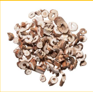
Gui Zhi / cinnamon cassia