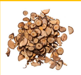
Yan Hu Suo / corydalis rhizoma