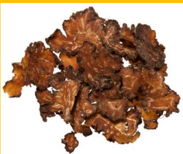
Chuan Niu Xi / cyathula root